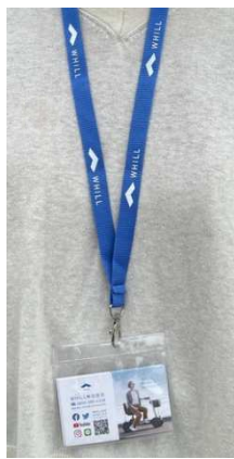
係員のネクスト ラップ

乗車希望やご不明点などはのりば付近にいるネクストラップをつけた係員までお声がけください。