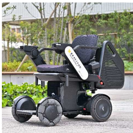
車いす型自動運転サービス [WHILLウィル]

信濃町駅から正面玄関に到着するまでの間にある【正門入口】と【正面玄関付近】に、車いす型自動運転サービス[WHILLウィル]のりばがあります。各のりばからの走行ルートは、「正門入口→正面玄関」と「正面玄関→正門入口」の2コースです。