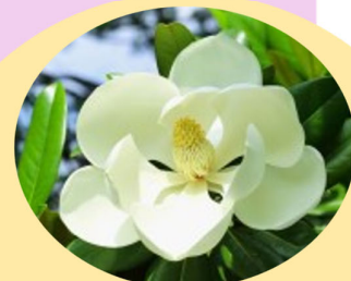
タイサンボク(泰山木)

以前の正面玄関前にありました。病院建替時に移植を検討しましたが成木の場合は困難ということで断念しました。とても愛された幸せな木でした。